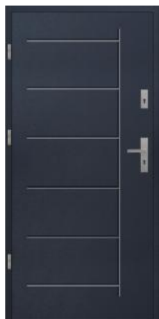
wood Anthracite (~RAL 7016)