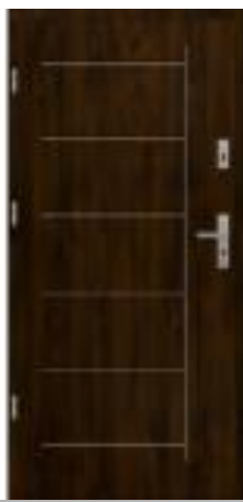
dark Walnut (~RAL 8017)