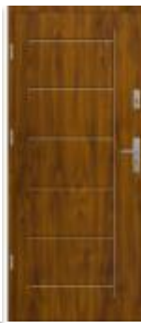
golden Oak (~RAL 8003)