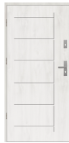
wood White (~RAL 9016)